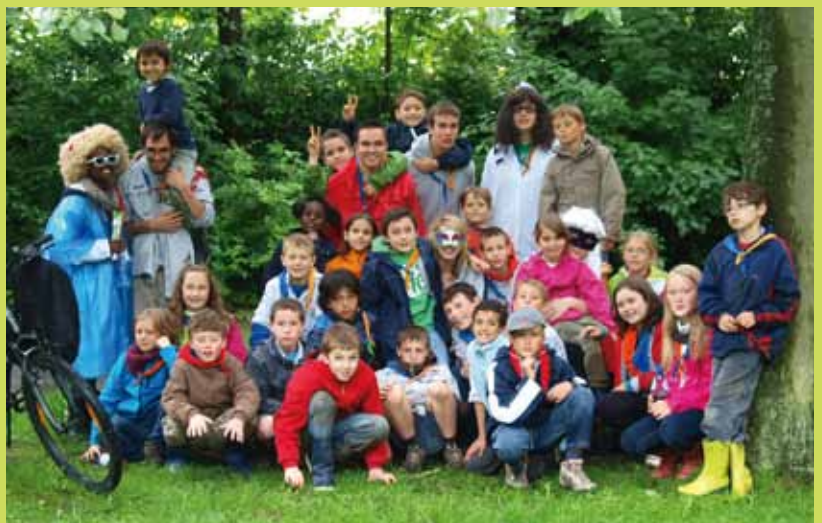
Les louveteaux des Unités de Spa et Pepinster ont passé un camp génial sur le thème "Retour vers le Futur" : chaque jour, une époque différente a rythmé le camp...