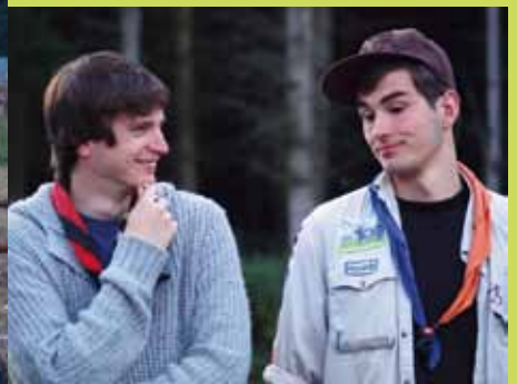
Les Troupes de la 155 e et 228 e ont passé quinze jours de télé-réalité lors de leur camp à Vissoule (Houffalize).