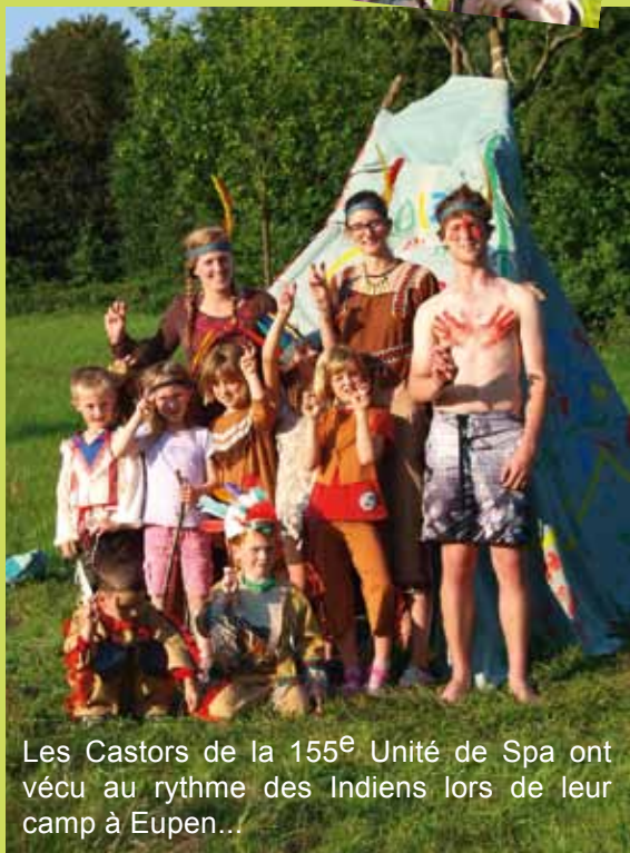
Les Castors de la 155 e Unité de Spa ont vécu au rythme des Indiens lors de leur camp à Eupen...