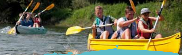
Tout baigne pour la Troupe de la 256 e Unité de Rixensart en camp à Paliseul !