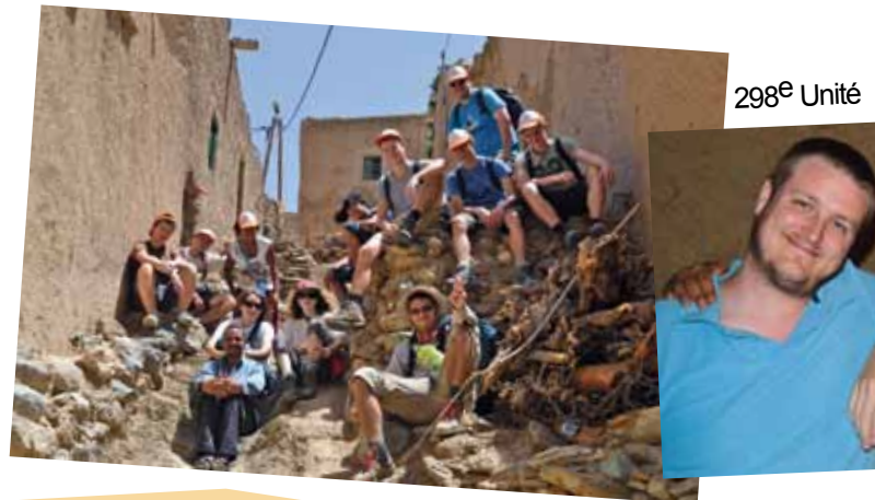
298 e Unité