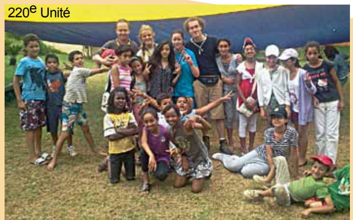
220 e Unité

Concernant l'organisation des activités, nous en proposons des différentes chaque jour et les groupes se formaient en fonction des envies des jeunes. Du sport aux ateliers créatifs, il y en avait pour tous les goûts.